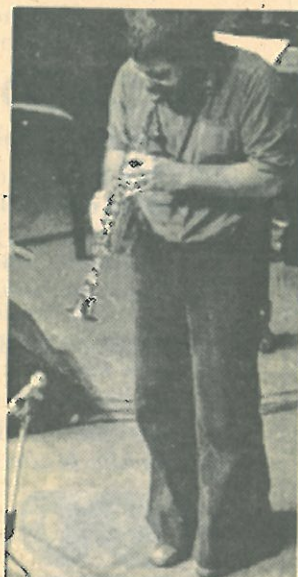
Evan Parker in concerto

C'è un album che testimonia il cammino di Parker verso la creatività totale: «Saxophone Solos» è una dimostrazione delle sue conquiste tecniche sul sax soprano e rivela la padronanza delle tecniche d'improvvisazione free, come la respirazione circolare, i colpi