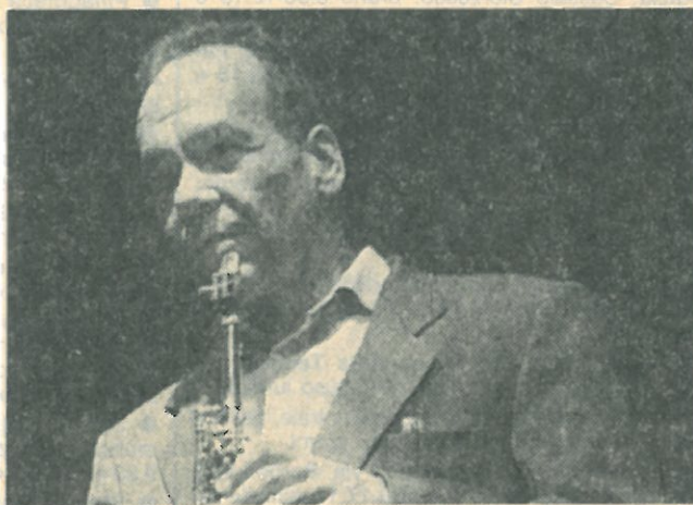
Il sassofonista Steve Lacy, oggi in due concerti al Capolinea

Un'altra occasione jazzistica di questa sera è offerta, con ingresso libero, all'Alcione di piazza Vetra,