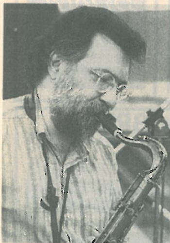
Evan Parker