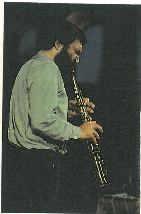
Il sassofonista inglese Evan Parker